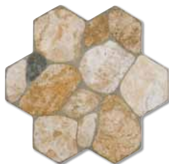
ANTARES S008 40x40 cm.